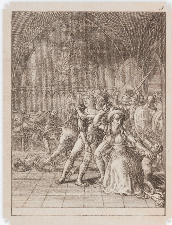
Nessa imagem histórica das Primeiras Cruzadas Cristãs, judeus foram forçados a renunciar sua fé e matar um ao outro.

Dito isso, quero dizer que existem crenças principais cristãs que têm sido desenvolvidas ao longo do tempo sem um acesso consistente à bíblia. Perceba que eu estou usando o termo cristianismo de uma forma abrangente, incluindo os Católicos, Protestantes, Coptos, Gregos, Russos, Ortodoxos Orientais, etc. Muitas denominações cristãs cresceram a partir da mensagem original dos judeus que seguiam Yeshua. No entanto, muitos cristãos nunca entenderam plenamente como a Nova Aliança se tornou acessível a eles. Infelizmente, algumas dessas denominações se afastaram dessa compreensão e, paradoxalmente, criticam as raízes judaicas que lhes deram origem.